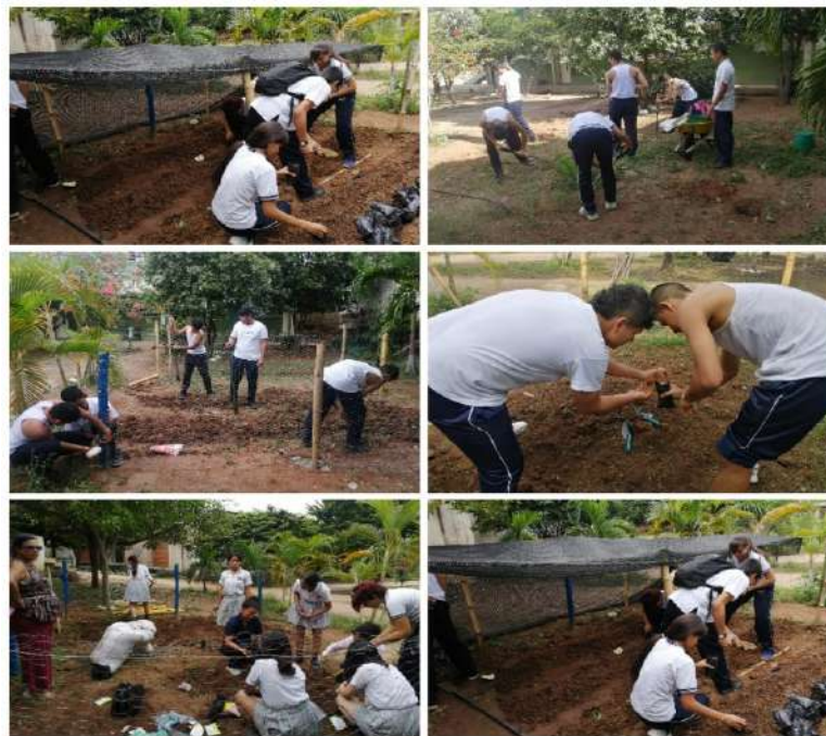
Figura 3. Construcción de la huerta escolar con participación de estudiantes y docente.

De esta manera, se hizo un proceso que inicio con la selección del lugar, y se empezó la articulación con el área de emprendimiento, para poder lograr que a futuro el proyecto de huerta escolar continúe. Paso seguido, se empezó a trabajar