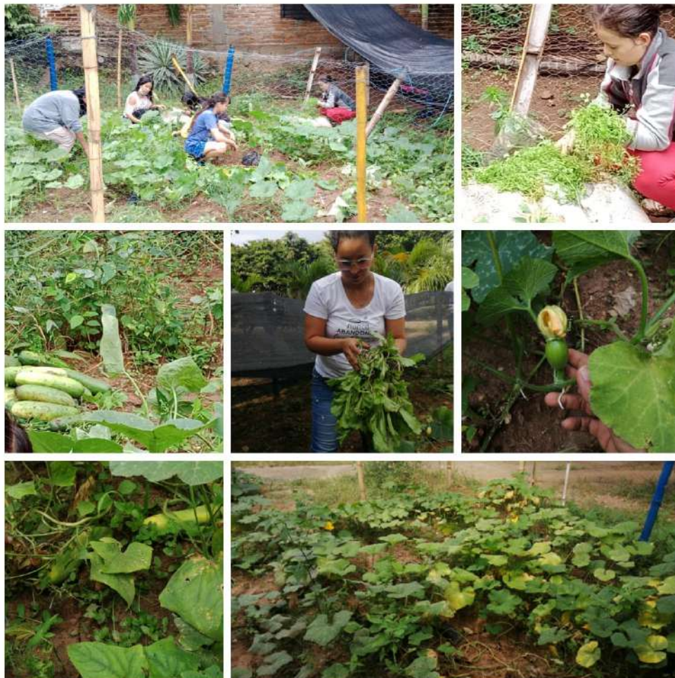
Figura 4. Nacimiento de lo sembrado y retoño de frutos. Registro propio.

Los estudiantes lograron sembrar productos alimenticios, pero además se logró abordar el cuidado al ambiente, al trabajo agrícola, reconocer los seres vivos y el espacio en el que cohabitan. A su vez, la huerta generó un espacio para poner en práctica los valores del respeto, el cuidado de especies y la responsabilidad por mantener la naturaleza en su estado viviente.