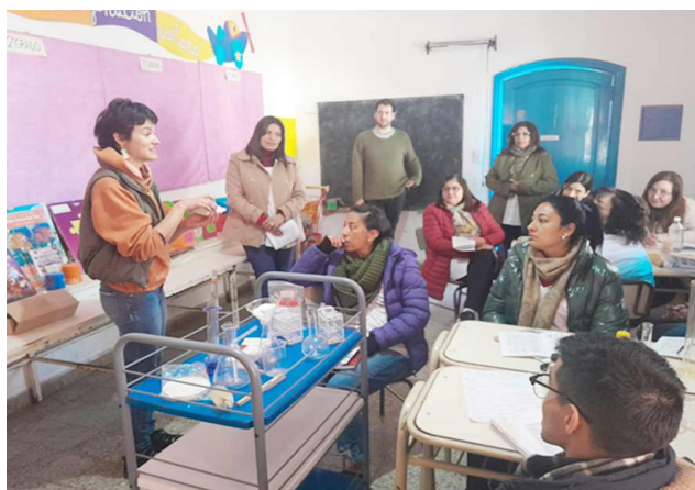
Figura 4 momento de alfabetización instrumental