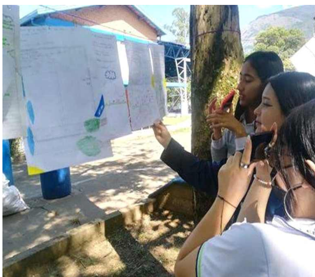
Figura 2 Saberes previos de los estudiantes sobre el concepto de ambiente

Del mismo modo se hizo una síntesis de la realidad aprehendida en la experiencia titulada "¿Cómo veo mi mundo?". En la figura 2 se observa la socialización de los conocimientos previos en la zona verde de la institución y uno de los dibujos de una de las estudiantes.