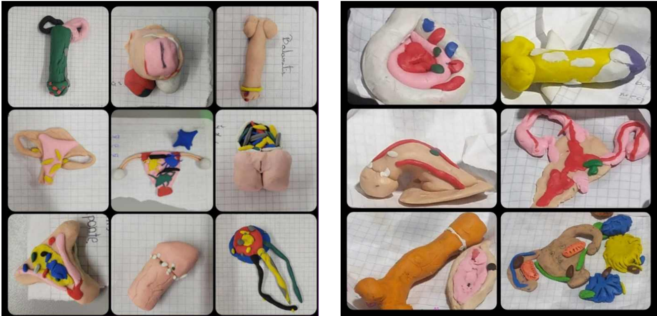
Fotografías de los modelados que realizaron los estudiantes representando los microbiomas presentes en la vagina y el pene.